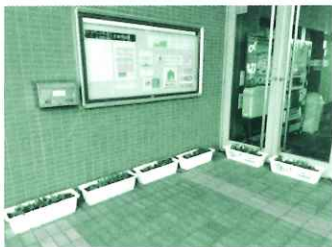
きらめきみなと館前