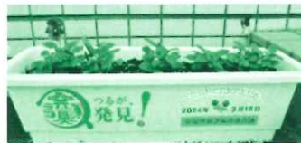
市民文化センター前